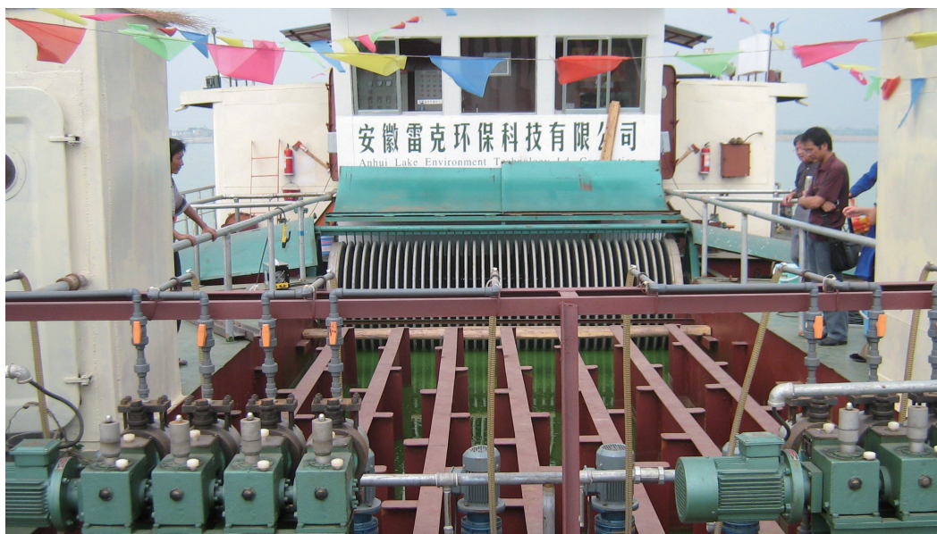
安徽巢湖应用现场

我国的大部分淡水湖泊以及周边海域都出现了不同程度的藻类污染，尤其是太湖、巢湖、滇池等出现了严重污染现象。经过初步测算，如果得到有效治理，每平方公里就要投入一条装有永磁絮体分离机的除藻船，并且需要运行3年以上时间才能有效遏制藻类发生，我国每年需要投入的治理蓝藻船只多达300条以上，且要连续投入多年才能从根本上彻底解决上述问题，市场前景广阔。