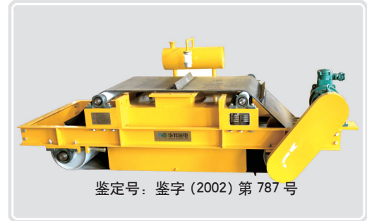
鉴定号：鉴字（2002）第 787 号